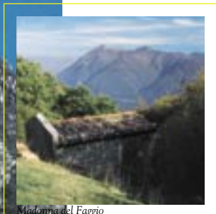
Madonna del Faggio

Arrivo ad Oria, primo borgo italiano della Valsolda, piccola valle incassata tra montagne che si gettano scoscese nel lago. Breve passeggiata su mulattiera acciottolata (in piano) fino alla casa del Fogazzaro, trasformata in museo privato per perpetuare il ricordo dello scrittore vicentino che sul Ceresio ambientò "Piccolo Mondo Antico", il suo romanzo più famoso e toccante. Eventuale visita del giardino.